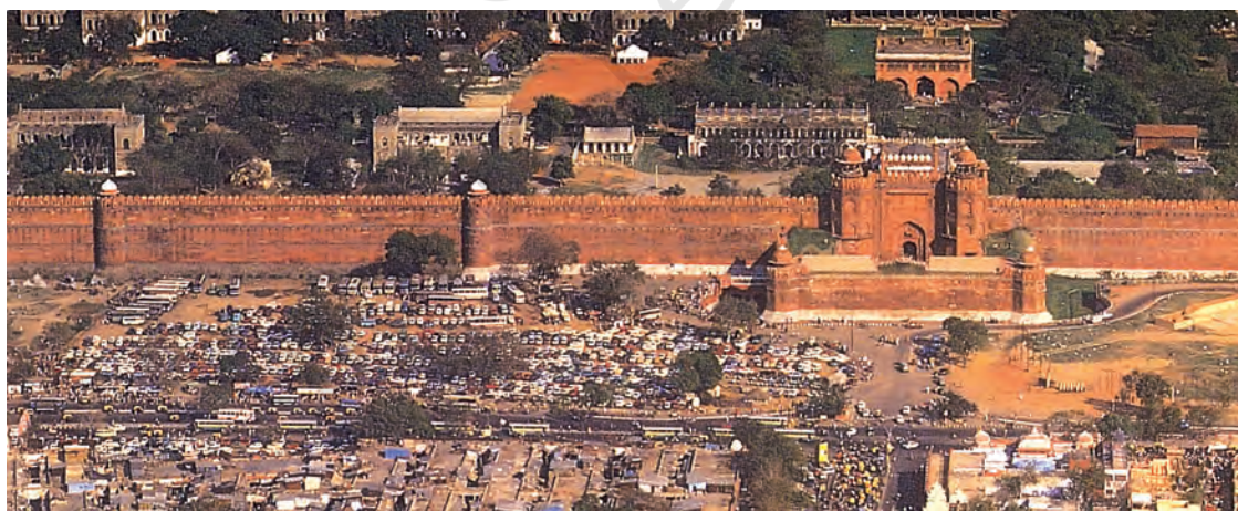
लाल किला (दिल्ली)

यदि अकबर ने इस तरफ़ ध्यान दिया होता और पता लगाया होता कि संसार के दूसरे हिस्सों में क्या हो रहा है तो उसने सामाजिक परिवर्तन की